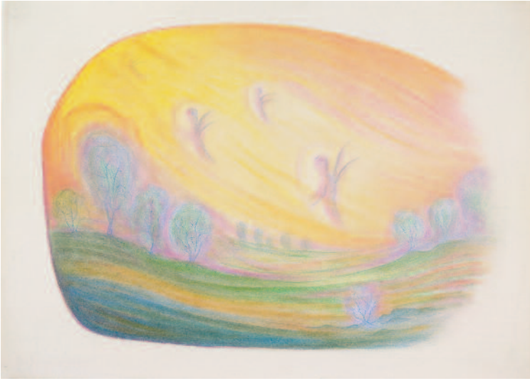
Totenseelen steigen auf 1959 (68 x 73 cm) TI 17

Menschen-seelen weben In der Morgenfrühe Über Busch und Baum, Lösen sich von Stoff und Schwere los, Schweben leicht im Äther Himmelan.