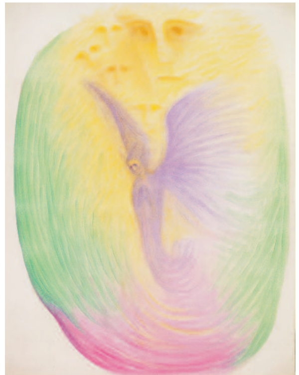
Der Todesengel 1957 (86 x 62 cm) TI 05

Der Todesengel hat eine würdige, strenge Aufgabe. Er begleitet die Seelen zurück in ihre Heimat. Doch der Abschied vom Erdendasein fällt manchem schwer. Wenig vertraut ist, was bevorsteht. Allzu sehr ist die Sphäre des Sterbens mit traditionell anerzogenen religiösen Bildern