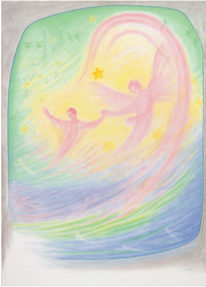
Seele in der Sphärenmusik 1968 (86 x 62 cm) MG 10

Neues Schweben, Neues Sinnen Führt mich auf in lichte Reiche. Immer weiter Immer höher Führt mich Christus An der Hand In mein weites, In mein tiefes In mein lichtiges Heimatland.