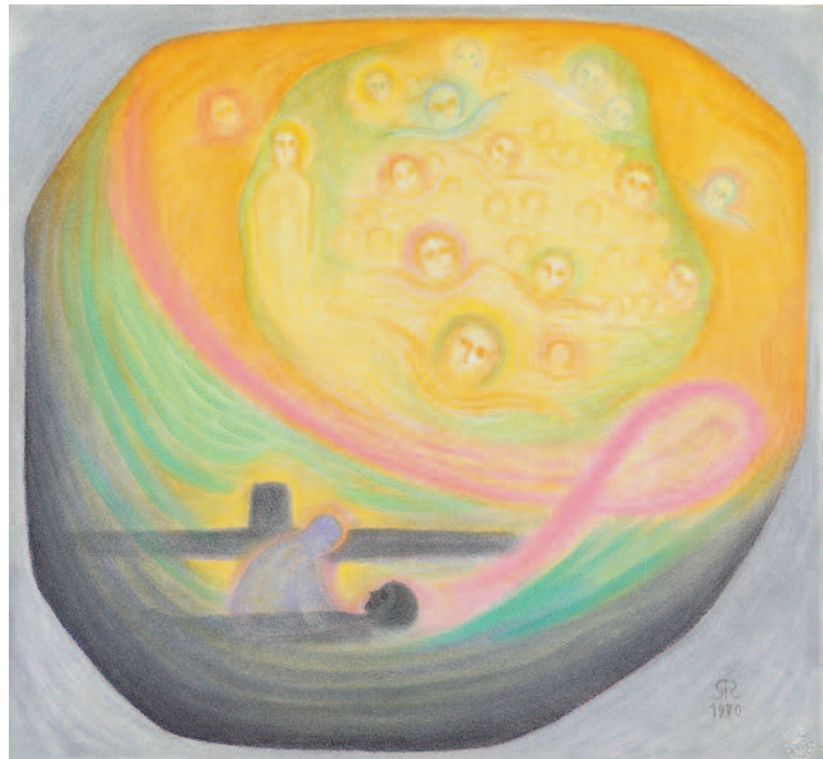
Totenwache (Todesstunde) 1970 (68 x 73 cm) TI 10