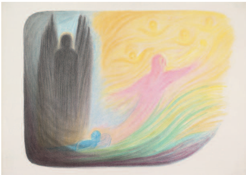
Der Todesmoment 1959 (86 x 62 cm) TI 08

Beim nachfolgenden Spruch, der den Blick auf das Geschehen jenseits der Schwelle lenkt, wird die Sprache von Gerhard Reich leichtflüssig, strömend-lebendig. Das lichte Ätherweben der auf- und absteigenden Seelen lebt auch im Rhythmus und Klang des Wortes. Der Atem des wirkenden Geistes wird spürbar. Der Leser wird seelisch unmittelbar mitgenommen. Innere bildhafte Erlebnisse können entstehen.