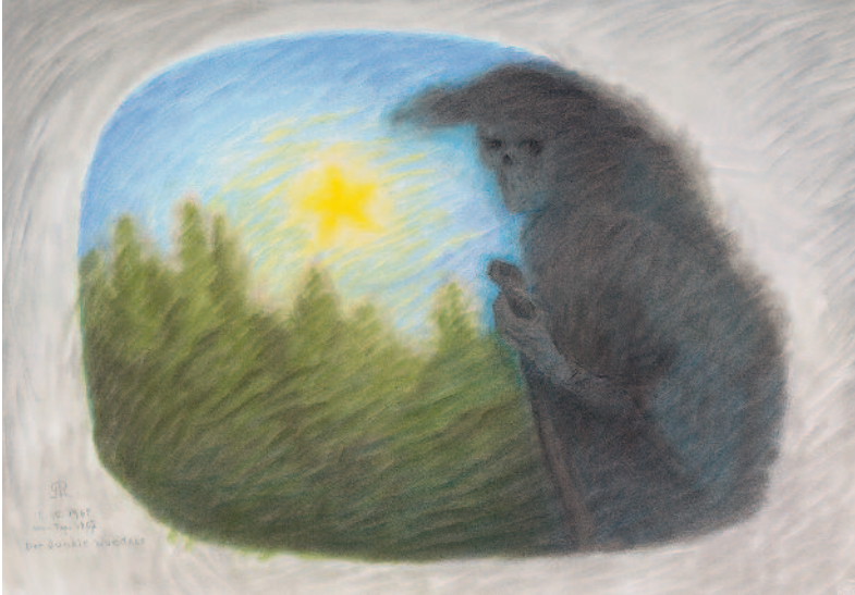
Dunkler Wanderer 1967 (86 x 62 cm) TI 03

Atem wechseln sich reines Geistdasein mit Erdendasein im Leibe ab. Die Verkörperung gibt Gelegenheit, sich selbst immer weiter zu entwickeln, wacher zu werden, man könnte auch sagen, hell zu werden. Denn für den Geistesforscher zeigt sich, dass da, wo der strebende Mensch Weltweisheit denkend durchdringt, er sich selber bis in seine Körperlichkeit stofflich unsichtbar verwandelt. Wer so durchs Leben geht, bereitet sich auf das Dasein nach dem Tod in einer Weise vor, dass ihm dann die Geistige Welt im Licht erscheint.