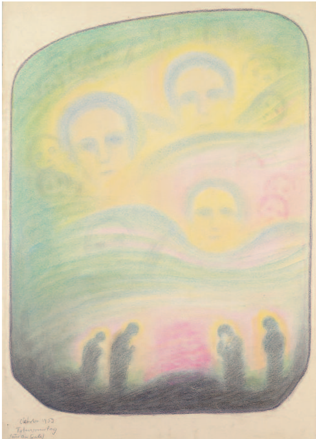
Totensonntag – Allerseelen 1953 (67 x 47 cm) TI 12