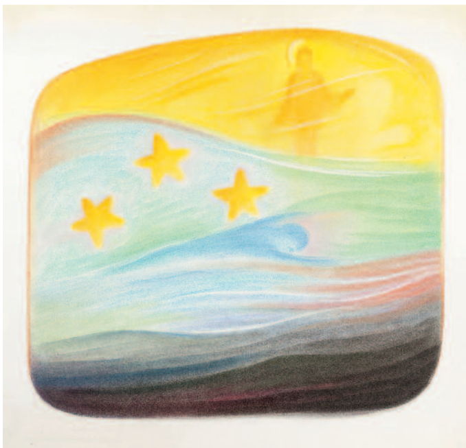
Totenseele im Traumschlaf 1959 (68 x 73 cm) TI 23

Im Schlafesdämmer lebst du dumpf dahin Und kaum ein Licht Scheint dir in diese Finsternis!