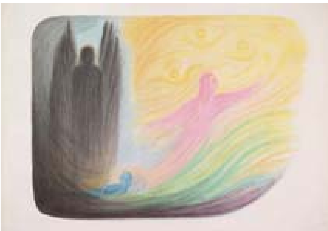
Der Todesmoment 1959 (86 x 62 cm) TI 08

Beim nachfolgenden Spruch, der den Blick auf das Geschehen jenseits der Schwelle lenkt, wird die Sprache von Gerhard Reisch leichtflüssig, strömend-lebendig. Das lichte Ätherweben der auf- und absteigenden Seelen lebt auch im Rhythmus und Klang des Wortes. Der Atem des wirkenden Geistes wird spürbar. Der Leser wird seelisch unmittelbar mitgenommen. Innere bildhafte Erlebnisse können entstehen.