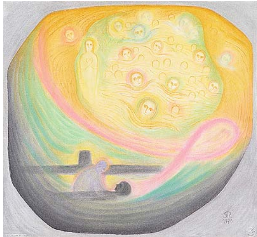
Totenwache (Todesstunde) 1970 (68 x 73 cm) TI 10

Einführung in Spruchworte und Bilder aus „Ein Totenbuch“ von Gerhard Reisch