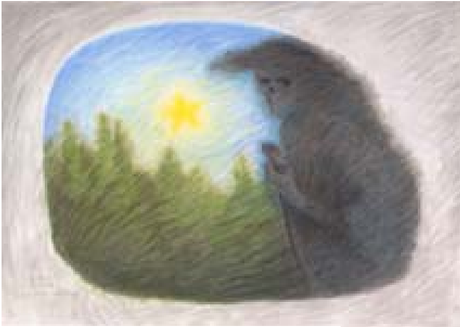
Dunkler Wanderer 1967 (86 x 62 cm) TI 03

Gelegenheit, sich selbst immer weiter zu entwickeln, wacher zu werden, man könnte auch sagen, hell zu werden. Denn für den Geistesforscher zeigt sich, dass da, wo der strebende Mensch Weltweisheit denkend durchdringt, er sich selber bis in seine Körperlichkeit stofflich unsichtbar verwandelt. Wer so durchs Leben geht, bereitet sich auf das Dasein nach dem Tod in einer Weise vor, dass ihm dann die Geistige Welt im Licht erscheint.