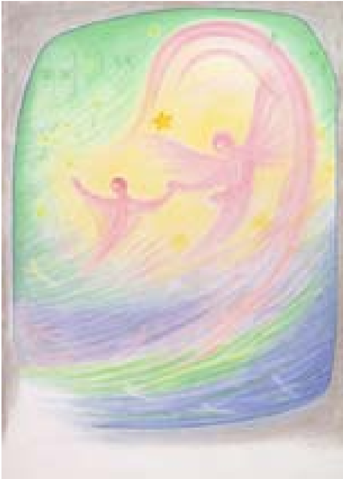
Seele in der Sphärenmusik 1968 (86 x 62 cm) MG 10

Neues Schweben, Neues Sinnen Führt mich auf in lichte Reiche. Immer weiter Immer Höher Führt mich Christus An der Hand In mein weites, In mein tiefes In mein lichtiges Heimatland.