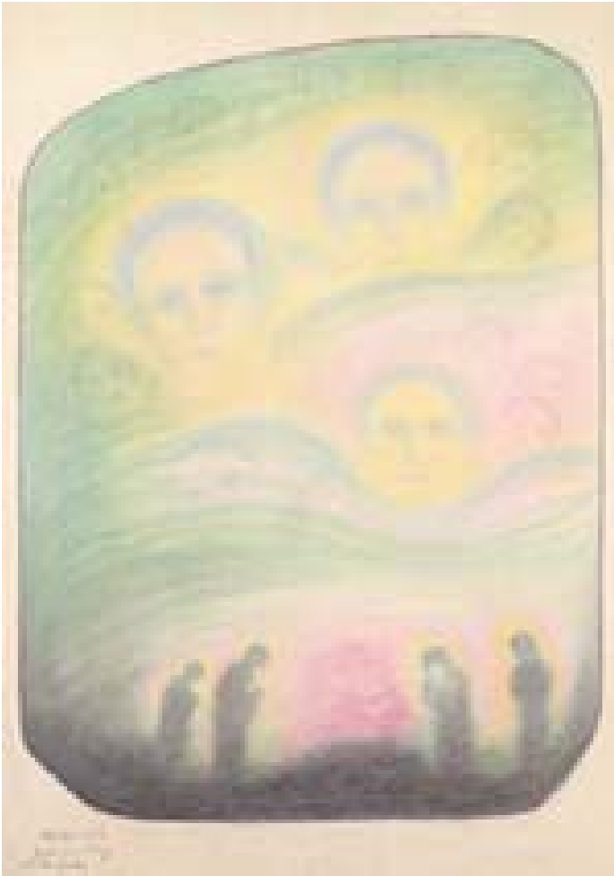
Totensonntag – Allerseelen 1953 (67 x 47 cm) TI 12