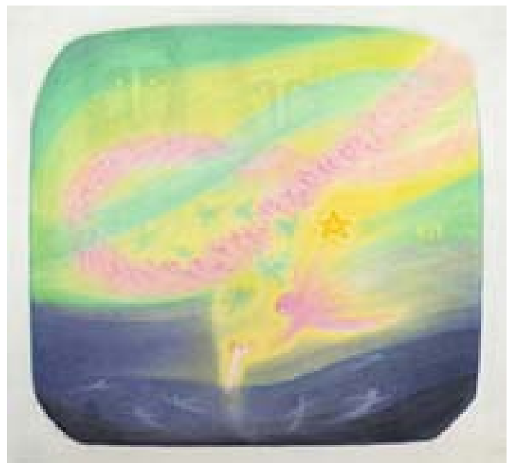
Seele im Erwachen 1970 (68 x 73 cm) TI 24 (Tod-Erwachen – Ich-Erwachen)

Früchte aus ihrem kurzen Erdendasein bringen Jungverstorbene auch höheren hierarchischen Mächten mit. Sie erweisen sich dadurch als Retter solcher Seelen, die sich im Materialismus verrannt haben: